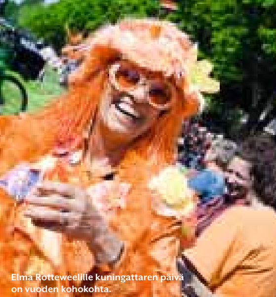
Elma Rotteweelille kuningattaren päivä on vuoden kohokohta.