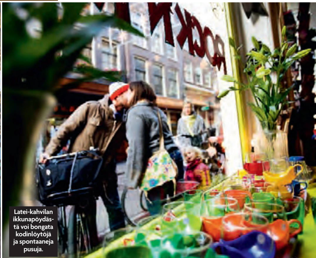
Latei-kahvilan ikkunapöydästä voi bongata kodinlöytöjä ja spontaaneja pusuja.