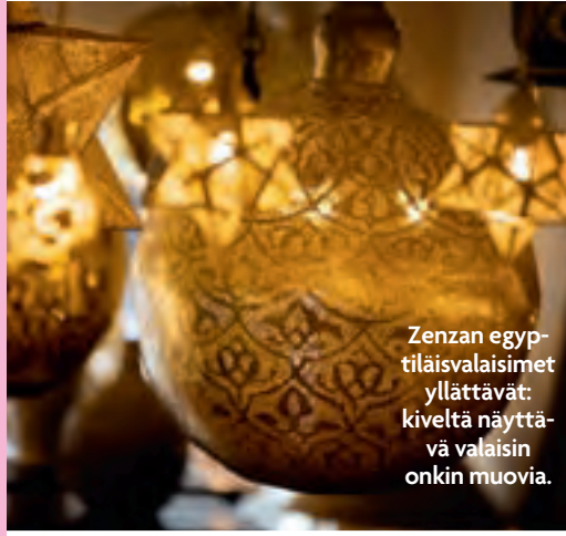
Zenzen egyptiläisvalaisimet yllättävät: kivetä näyttävä valaisin onkin muovia.