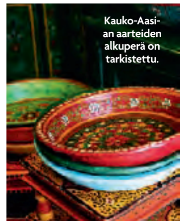
Kauko-Aasian aarteiden alkuperä on tarkistettu.

Hollantilaisten roskahuolto on simppeleä touhua: pussit ja roinat nakataan parina iltana kadulle, josta jätehuollon miehet noutavat ne auton kyytiin aamulla. Etenkin opiskelijat, mutta myös kirpputorimyyjät ja retrotyylin ystävät kuljeskelevat iltaisin kaduilla etsimässä hylättyjä huonekaluja ja kodintavaroita. Roskapäivät vaihtelevat kaduittain. Kanavakehän antia pidetään parhaana.