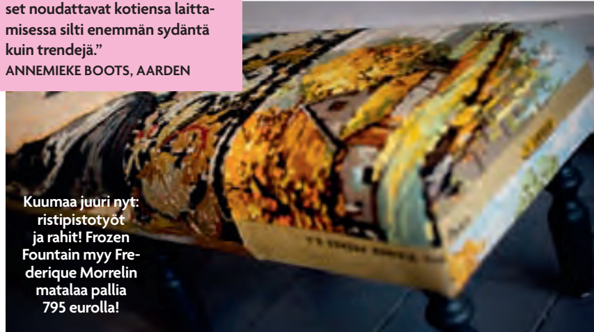
Kuumaa juuri nyt: ristipistotyöt ja rahat! Frozen Fountain myy Frederique Morrelin matalaa pallia 795 eurolla!