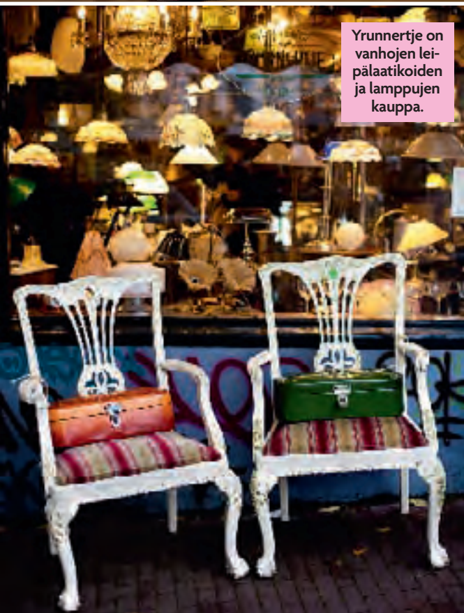
Yrunnertje on vanhojen leipälaatikoiden ja lampujen kauppa.

Amsterdammassa on uskomaton kirjo liikkeitä ja baareja.