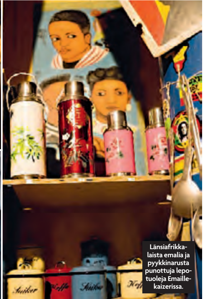
Länsiafrikkalaista emalia ja pyykkinarusta punottuja lepotuoleja Emaill-kaizerissa.