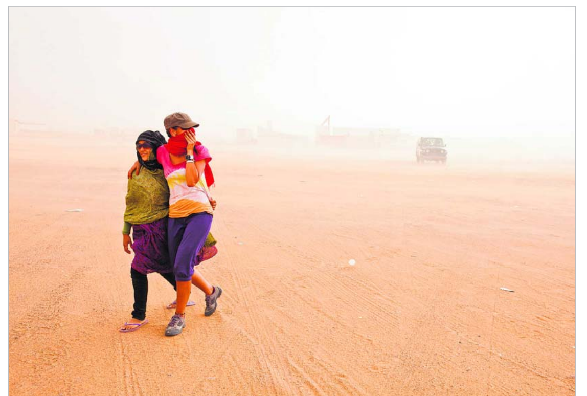
Hiekkamyrsky voi nousta koska tahansa. Ilma tuntuu kuumalta kuin hiustenkuivaajan puhallus.