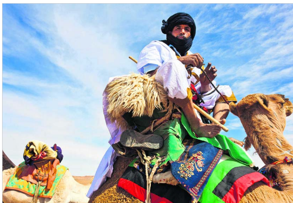
Kamelikytyt on kätevä aavikolla.