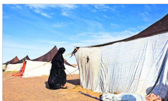
Dakhlan pakolaisleirillä asuu 30 000 ihmistä.