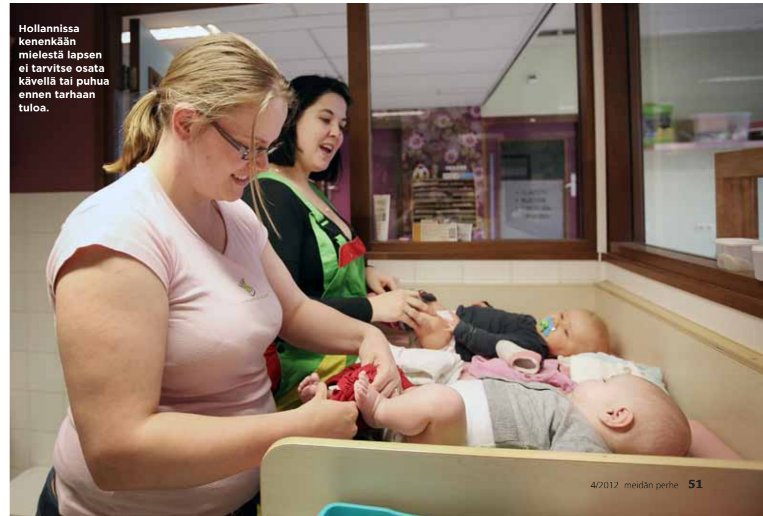
Hollannissa kenenkään mielestä lapsen ei tarvitse osata kävellä tai puhua ennen tarhaan tuloa.

– Silloin naisten koulutusta ja osaamista ei menisi hukkaan.