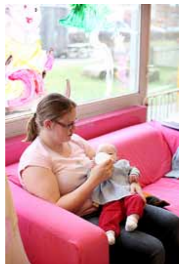
Fennen hoitaja sanoo, että kolmikuiset sopeutuvat päiväkotiin paremmin kuin yksivuotiaat.

kodin jääkaapeissa on toisinaan myös äitien tuomaa rintamaitoa, mutta on melko tavallista, että äidit lopettavat imetyksen töihin palatessaan.