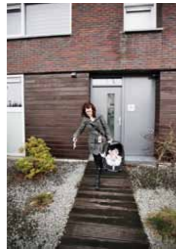
Fennellä, 4 kk, on monta hoitajaa viikon aikana - oma äiti, päiväkodin hoitajat sekä mummo.